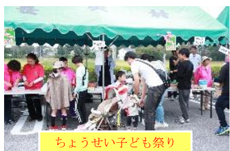
ちようせい子ども祭り

スズランの会として、全力で応援したいと思っております。会員の皆様のご支援、ご協力をお願いいたします。