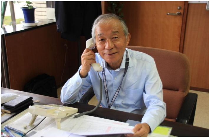
5万円以上の寄付者に電話する小高村長

「小高村長、長生村が日本一です。感想をうかがいます。」 八月七日、取材の約束をしていた読売新聞の記者は、村長室に入りなりました。何のことも聞くと、前日総務省からふるさと納税の全国集計が発表され、二〇一九年度の本村への寄付額七億九千二百五十万円が 全国一八三の村 の中では トップ だそうです。